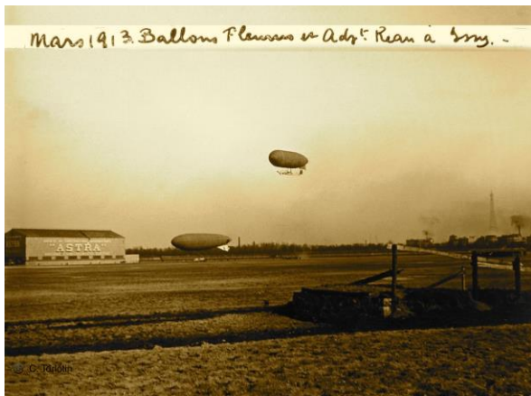
Mars 1913 – Dirigeables « Réau » et « Pleurus »