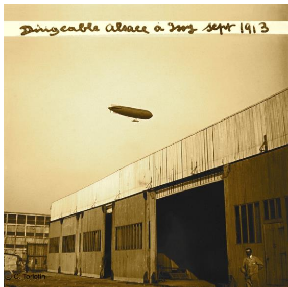
Septembre 1913 – Dirigeable « Alsace »