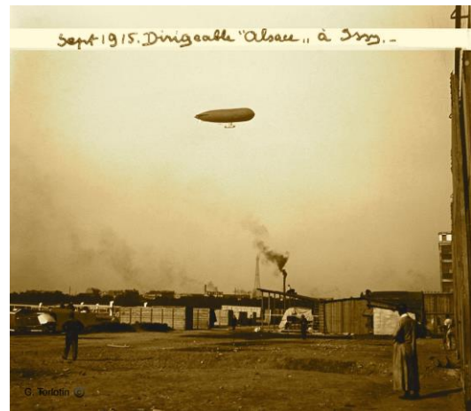
Septembre 1915 – Dirigeable « Alsace »