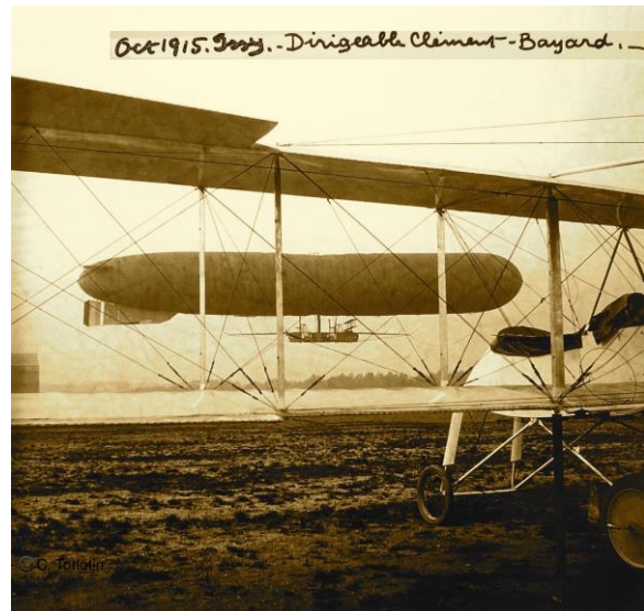
Oct 1915 – Dirigeable Clément-Bayard