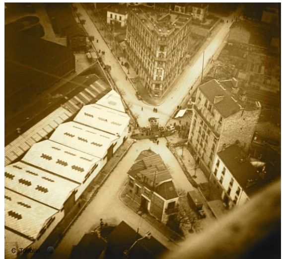
Le 3 avril 1916, accident du « Lorraine » au cours d'un vol d'essai nocturne et aux abords du champ de manœuvre d'Issy les Moulineaux